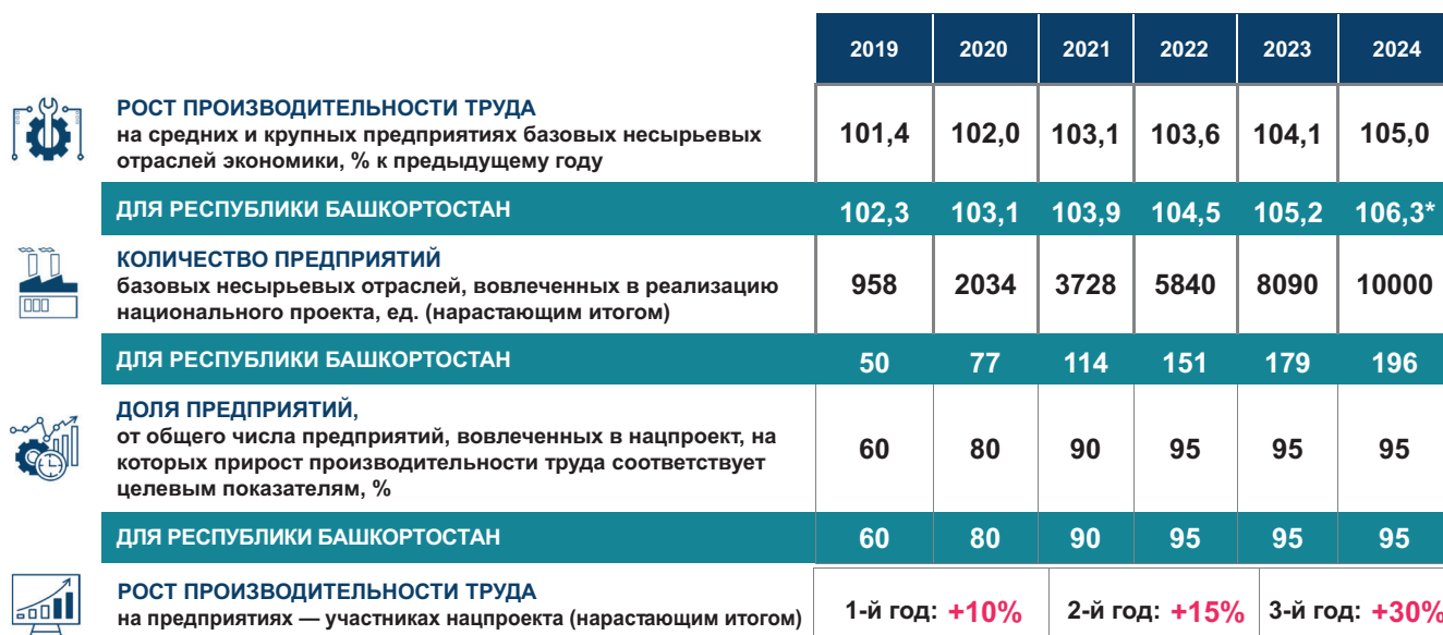
Рисунок 2. Ключевые показатели нацпроекта «Производительность труда и поддержка занятости»

В числе наших задач: на 16 предприятиях внедрить механизм бережливого производства силами регионального центра компетенций, еще на 16 — с привлечением внешних консультантов за счет федерального финансирования. Мы должны обеспечить финансирование мероприятий по созданию «Фабрики процессов», привлечь консультантов для работы на предприятиях, реализующих проекты самостоятельно. Но уже сегодня можно констатировать, что участие в национальном проекте «Производительность труда и поддержка занятости» дает возможность получить профессиональные компетенции и наработать собственную практику по оптимизации производственных и технических процессов, формируя современную культуру производства и стандарты.